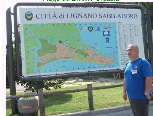
Urba centro de Linjano Orsabla