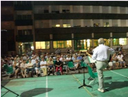
Koncerto de Bronŝtejn