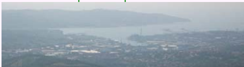
Triesta haveno vidita el la karsta montaro