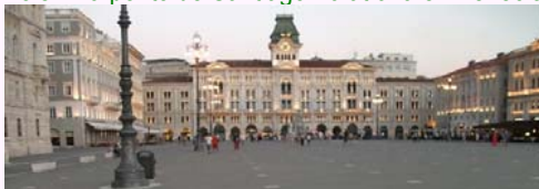
Ĉefa apudmara placo de Triesto