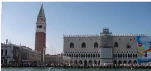
Tramara atingo de ekskurso al Venecio, placo de Sankta Marko