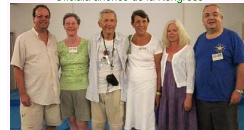
Ses kongresanoj venintaj de Belgujo