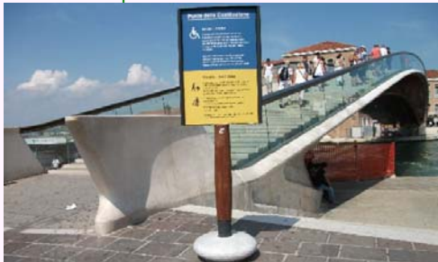
Polemika ponto de Santiago Kalatrava en Venecio