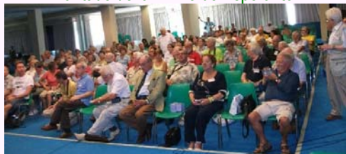
Ĉeestantoj dum la inaŭguro