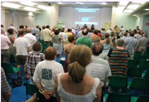
Malantaŭa vido de la inaŭguro dum staranta kantado de la himno de Esperanto